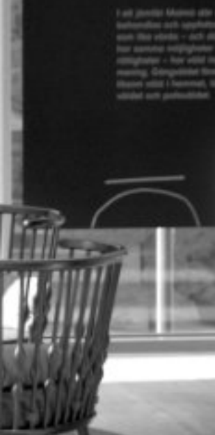
OLLE ELFSTRÖM, TENORTROMBON