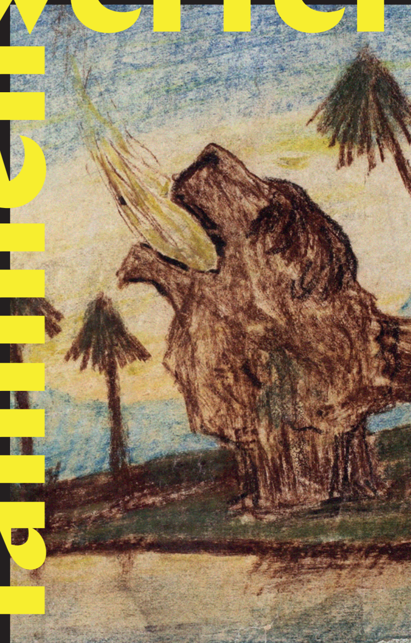
Carl Fredrik Hill, Utan titel (Landskap med eldsprutande lejon och palmer). Utan årtal (1883-1911).